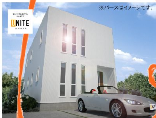
※パースはイメージです。